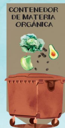
CONTENEDOR DE MATERIA ORGÁNICA

TODO TIPO DE PILAS Y BATERÍAS, SEAN RECARGABLES O NO