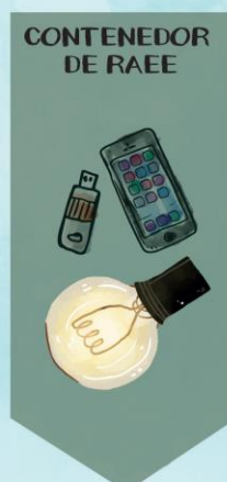
CONTENEDOR DE RAEE

MEDICAMENTOS Y SUS ENVASES. SE ENCUENTRAN EN LAS FARMACIAS