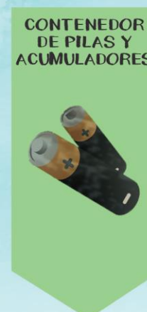
CONTENEDOR DE PILAS Y ACUMULADORES

RAEE: RESIDUOS DE APARATOS ELÉCTRICOS Y ELECTRÓNICOS, COMO BOMBILLAS, MÓVILES USADOS, ENTRE OTROS