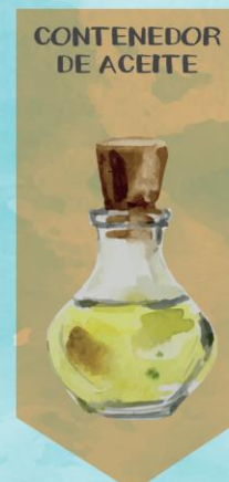
CONTENEDOR DE ACEITE

ACEITE VEGETAL DE ORIGEN DOMÉSTICO (COCINA)