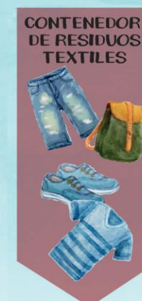
CONTENEDOR DE RESIDUOS TEXTILES

YA HAY INICIATIVAS PARA COMPOSTAR LA MATERIA ORGÁNICA Y CONVERTIRLA EN COMPOST O ABONO